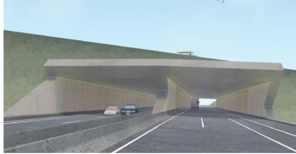
Secteur 4 – AVP 2020 franchissement A26