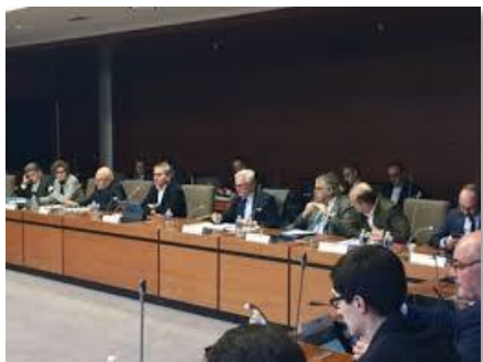
Le conseil de surveillance