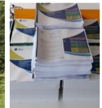
Secteur 1 Dossier d'autorisation Environnementale 2019