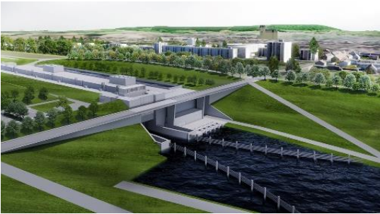
Secteur 2 – AVP - 2020 Ecluse Noyon