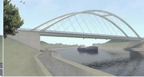
Secteur 4 – AVP 2020