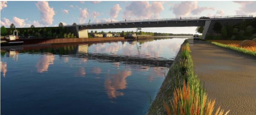
Secteur 1 – études de PRO 2019-2020