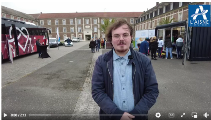
Les Journées Aisne actifs Plus, c'est quoi ?